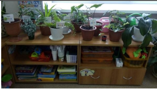
Центр науки и естествознания