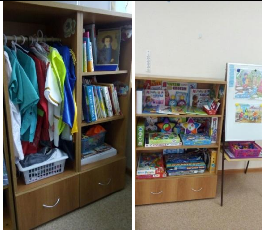
Центр сенсорного развития