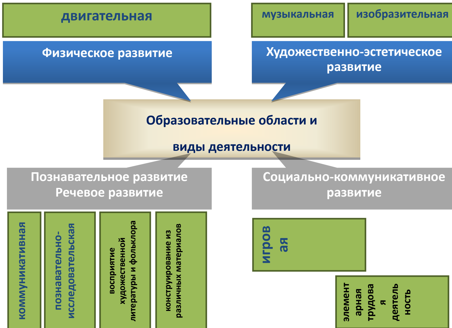
Компоненты образовательных областей по ФГОС дошкольного образования: