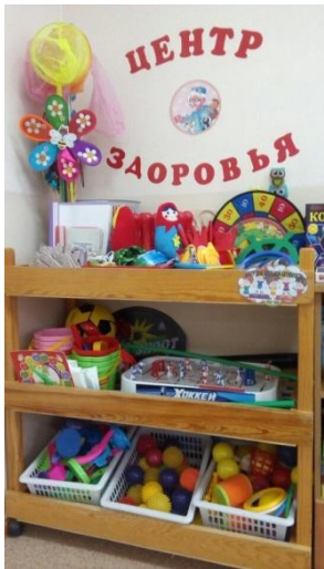
Центр двигательной активности

Оборудован спортивным, оздоровительным оборудованием, инвентарем для двигательной активности и участия в подвижных играх: ленты, мячи, обручи, кольцебросы, кегли, вожжи, картотеки утренней гимнастики, гимнастики после сна, подвижных игр, динамических пауз.