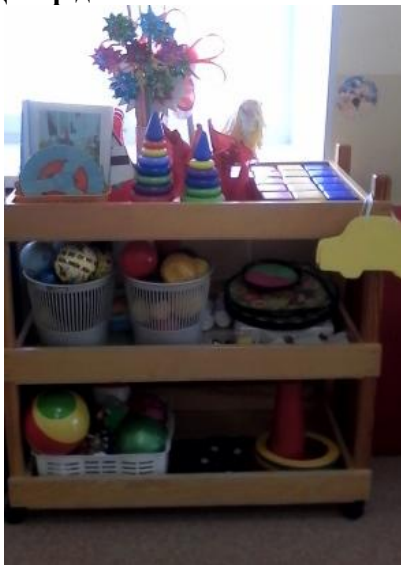
Центр уединения и настроения

Оборудование: дидактические игры о домашних и диких животных, среде их обитания, временах года и природных явлениях, природный материал комнатные растения, алгоритмы ухода за ними, лейки, совочки для рыхления, емкости для опрыскивания.