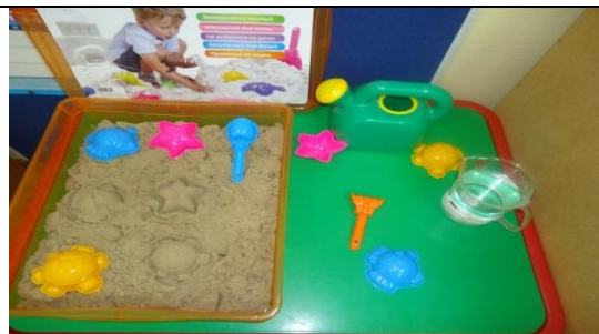
Центр науки и естествознания