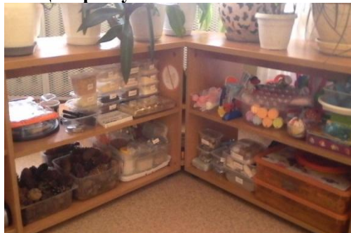
Центр двигательной активности